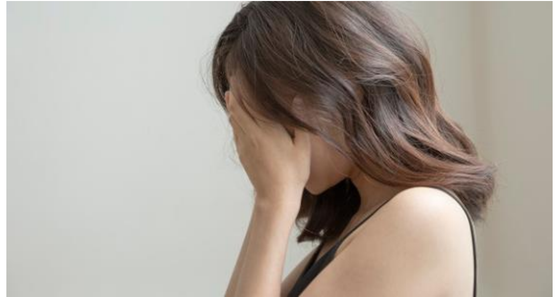
근심 걱정하게 만드는 자녀